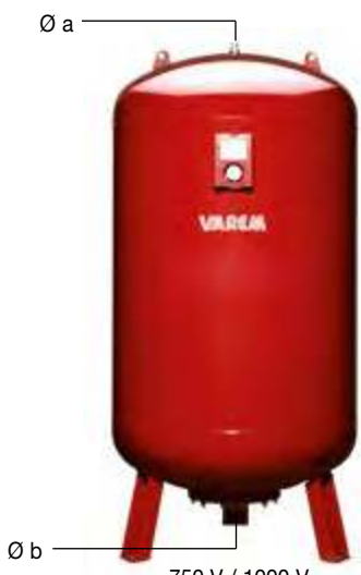
750 V / 1000 V