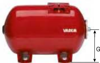
60 H à 300 H