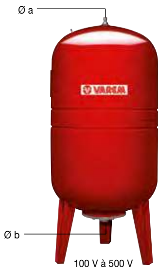
100 V à 500 V