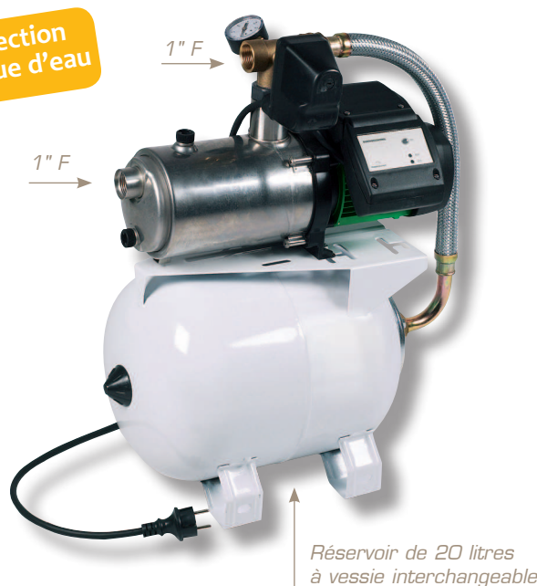
Réservoir de 20 litres à vessie interchangeable

Performances maxi : 4 m 3 /h 44 m - 4,4 bars