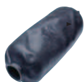
Vessie 100, 500 l verticale 200, 300, 500 l horizontale