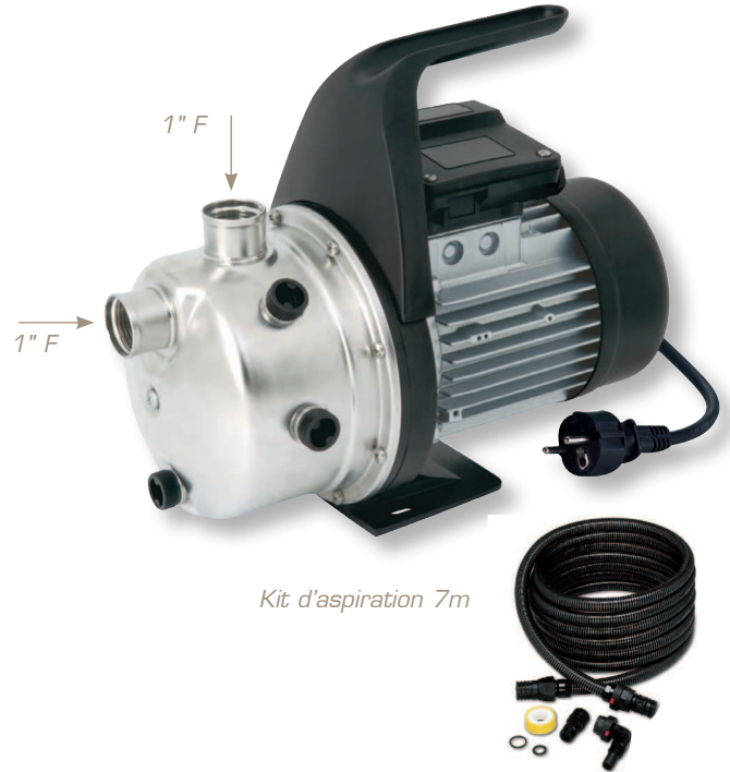
Kit d'aspiration 7m

Les pictogrammes facilitent le choix des produits à partir de données généralisées. Toute configuration différente doit être étudiée de façon personnalisée.