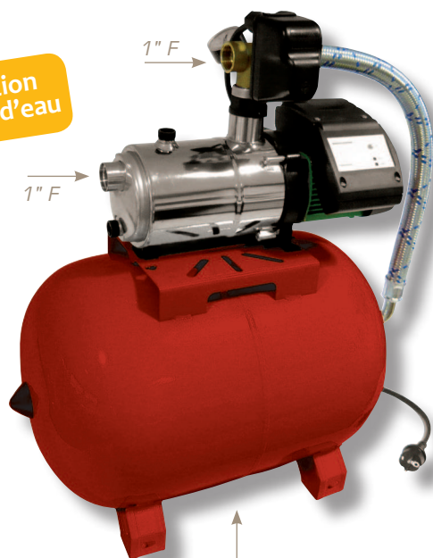
Réservoir de 100 litres à vessie interchangeable

Performances maxi : 4 m 3 /h 44 m - 4,4 bars