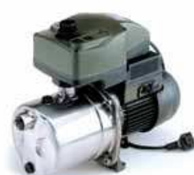
ACTIVE EURO-INOX (EI)