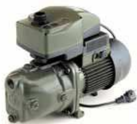
ACTIVE JET (J)

Groupes automatiques de pompage auto-amorçants.