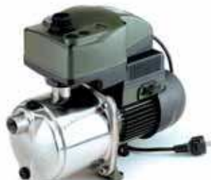
ACTIVE JETINOX (JI)