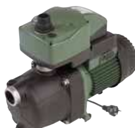
ACTIVE JETCOM (JC)